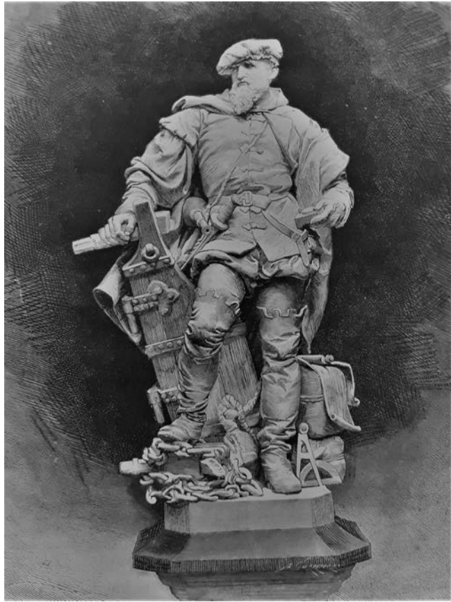
Figura I.4. Estatua de Juan Sebastián Elcano, proyectada por Ricardo Bellver, que iba a erigirse en el Ministerio de Ultramar. La Ilustración Española y Americana , 25 (julio, 1879). Biblioteca Real Círculo de Labradores. Sevilla.

sesgadas. Un tópico es el que dice que la vida de Juan Sebastián Elcano es “en buena medida desconocida” y su biografía “escasa e incompleta”. Quizás la causa haya sido el desdén silencioso que Pigafetta aplicó a Elcano en su Diario , con respecto a su amplia panoplia de alabanzas al primer protagonista, Magallanes. La figura de Elcano no puede quedar desdibujada por esos silencios, que en toda la vuelta desde Tidore hasta Sanlúcar y Sevilla callan al de Guetaria. El sujeto de todas las peripecias y estrategias de la nao Victoria al mando de Elcano es siempre un “nosotros”, no un “él”, un pronombre en primera persona y plural: “seguimos nuestra derrota”, “doblamos este terrible cabo”, “nos vimos obligados a arribar a una de las islas de Cabo Verde”, “dimos fondo en la bahía de Sanlúcar de Barrameda”. Con esta gramática parece que Elcano no hizo nada extraordinario con respecto a los demás que formaban la tripulación. Desdén que ha transmitido en muchos de los que acuden a él como fuente primordial y única.