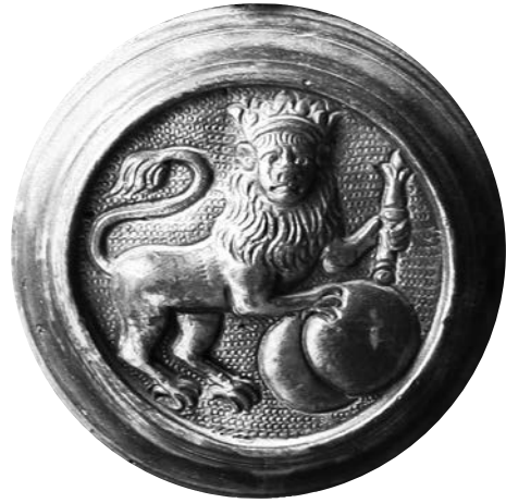
Figura I.1. Emblema de la monarquía española. León vigilante y panóptico que somete al viejo y nuevo mundo. Portón de la Real Fábrica de Tabacos. Sevilla.

Por eso en la instrucción real dada a Diego Ortiz de Orue para el ejercicio del cargo de contador en la armada del Comendador Loaysa el 5 de abril de 1525 queda clara la finalidad panóptica de la escritura en las naos. Se le