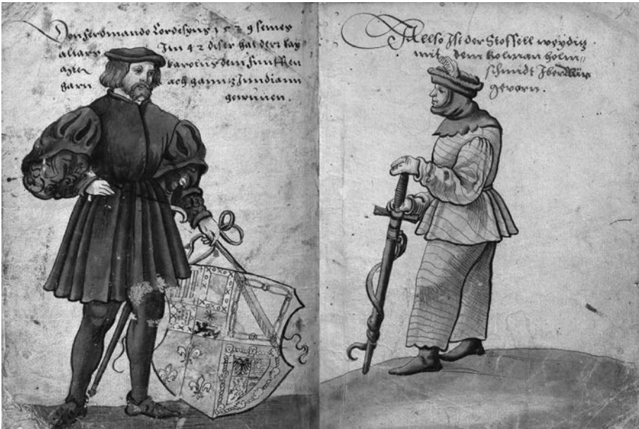
Figura I.2. El uso heráldico de los primeros descubridores de Indias. Hernán Cortés. Christoph Weiditz, Trachtenbuch , 1529.

La vostra nominanza è color d'erba, che viene e va, e quei la discolora per cui ella esce de la terra acerba 33 .