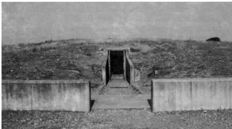
Figura 3. Dolmen de Zancarrón de Soto en la actualidad. Acceso