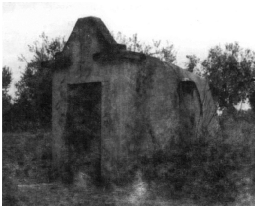
Figura 1. Dolmen de Matarrubilla en la actualidad. Casamata de acceso