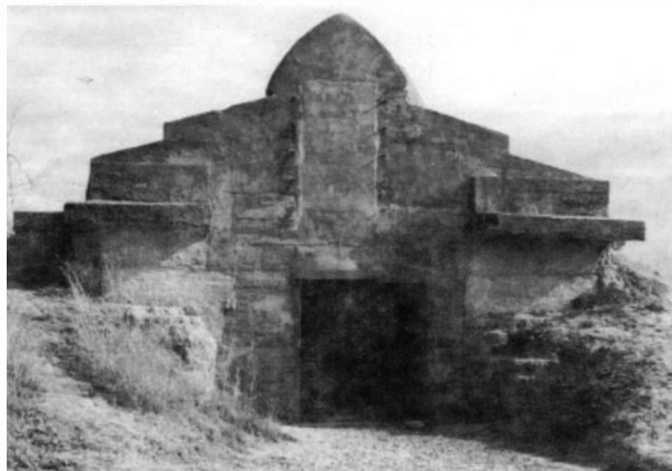
Figura 2. Dolmen de Cueva de La Pastora en la actualidad. Casamata de acceso